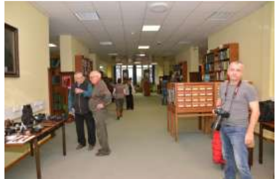
A gyulai Székely Aladár Fotóklub kiállítása