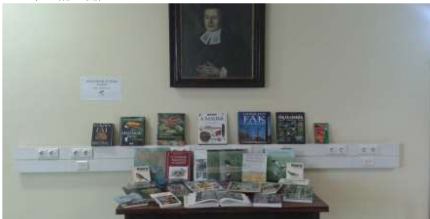
Könyvkiállítás a Madarak és Fák napja alkalmából