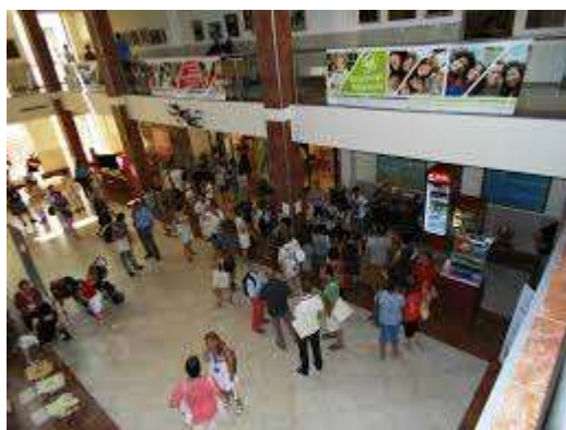
Magyar Könyvtárosok Egyesülete 47. vándorgyűlése Szolnok