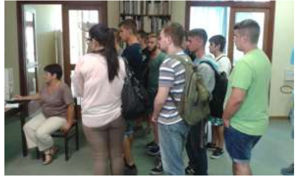
2015. augusztus 31