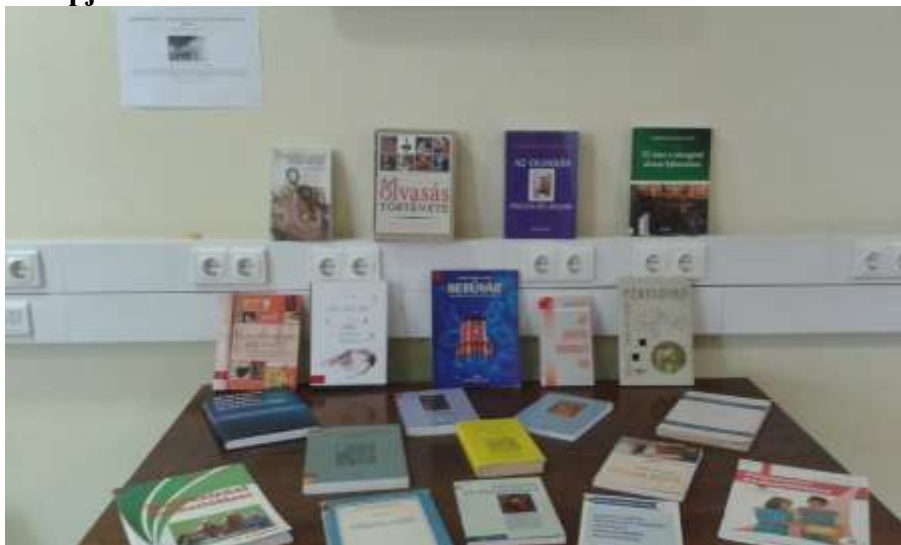
Könyvkiállítás az írni-olvasni tusás nemzetközi világnapja alkalmából