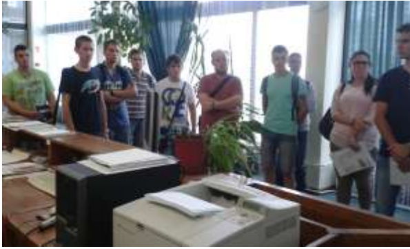
Gólyatábor Tessedik Campus