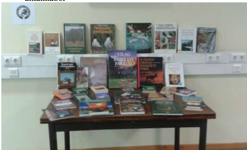
Könyvkiállítás az európai Nemzetiparkok