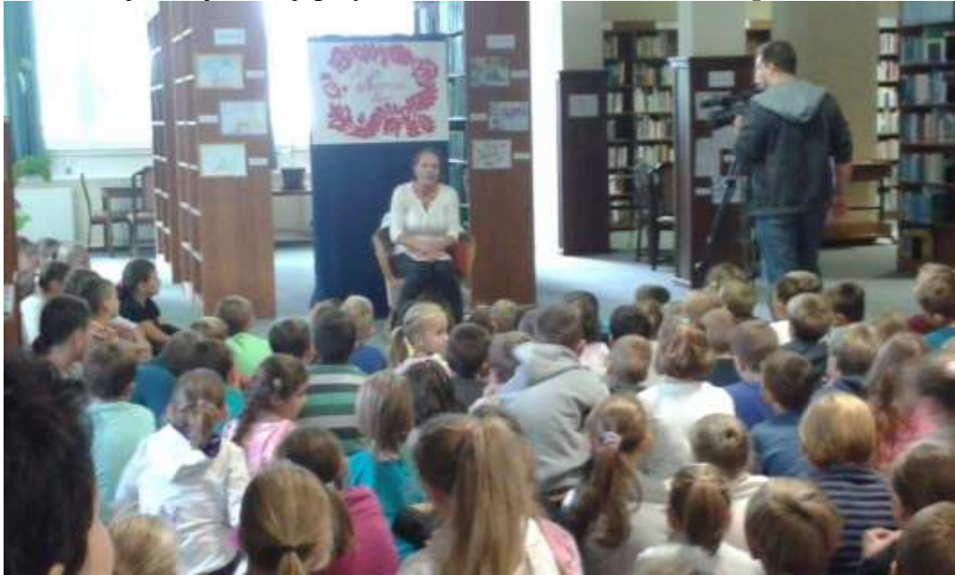
Népmese Napja – Dósa Zsuzsa színművész mesélt