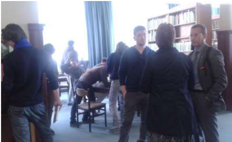
Francia hallgatók látogatása a könyvtárban /Erasmus/